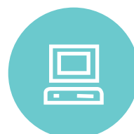
E- & VR-assessments